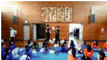
初級者研修会 顧問会の名コンビ、工作を名解説！