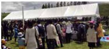
親子たこあげ大会 わたあめとお菓子の掴み取り出店！大繁盛！！