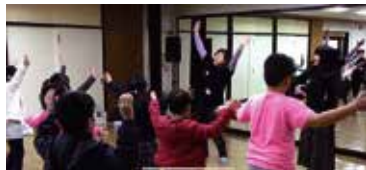
まなぼーと 縁日開催！ダンスコーナーで大盛り上がり！