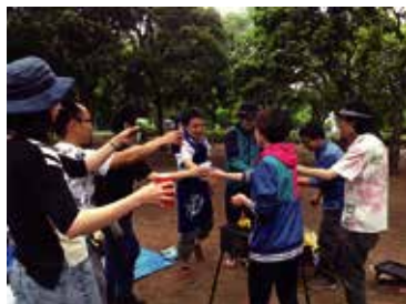
野外炊飯研修 BBQ 顧問会の三大懇親会の一つ。みんなで乾杯～！ ※上記の写真は全て新型コロナウイルス感染症流行前に撮影しました。